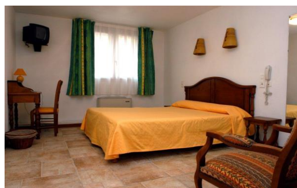
Chambre Les 4 SOURCES