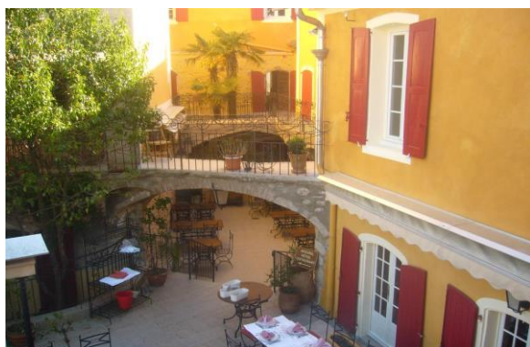
Hôtel l'ORANGE à St Jean du Gard