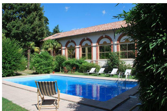
Hôtel Les BELLUGUES à St Jean du Gard