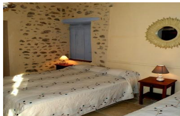
Chambre Hôtel l'ORON