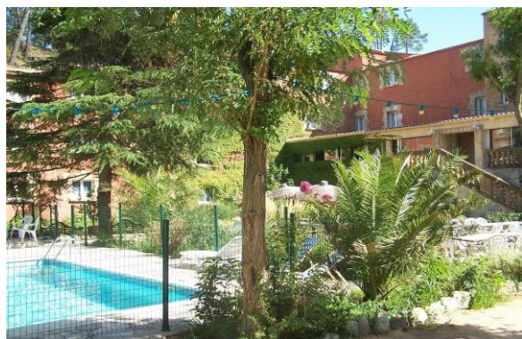
Hôtel Les 4 SOURCES à Anduze

SAMEDI: 18h30 à 19h00 PRISE POSSESSION DES CHAMBRES AUX HOTELS